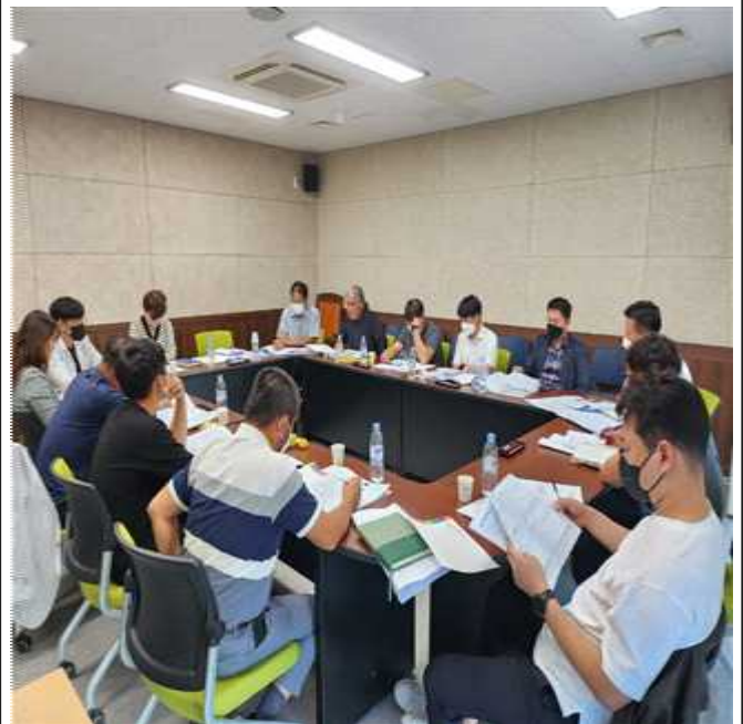
지역 특화품목 선정 및 활성화를 위한 간담회 개최(2022.9.21.)