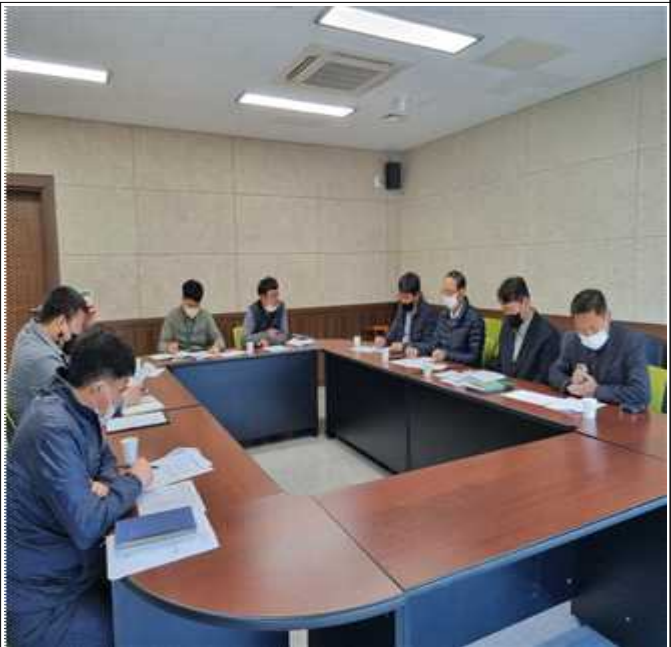
농업분야 행정-농협 협력사업 추진간담회 개최(2022.11.4.)